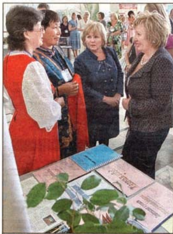
Супруга премьеры с удовольствием беседовала с библиотекарями и не могла оторваться от стендов с методической литературой.

Супруга премьеры говорила это эмоционально, что даже прослезилась: «У меня слезы на глазах... Какой удивительный символ выбран для российских школьных библиотек - бумажный кораблик. Кажется, от того и гряди утонет. Но вот он не тонет! И это настолько точно...»