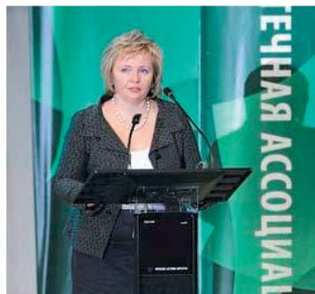
Людмила Путина считает, что школьных библиотекарей нужно приравнять к педагогам

Новый закон об образовании нужно скорректировать таким образом, чтобы библиотека стала считаться обязательным структурным подразделением школы, а школьный библиотекарь хотя бы чуть-чуть улучшил свое положение. Помочь добиться этого намерена Людмила Путина, супруга премьер-министра. В четверг она побывала на форуме школьных библиотекарей "Михайловское-2010", проходящем в Пушкинских Горах Псковской области.