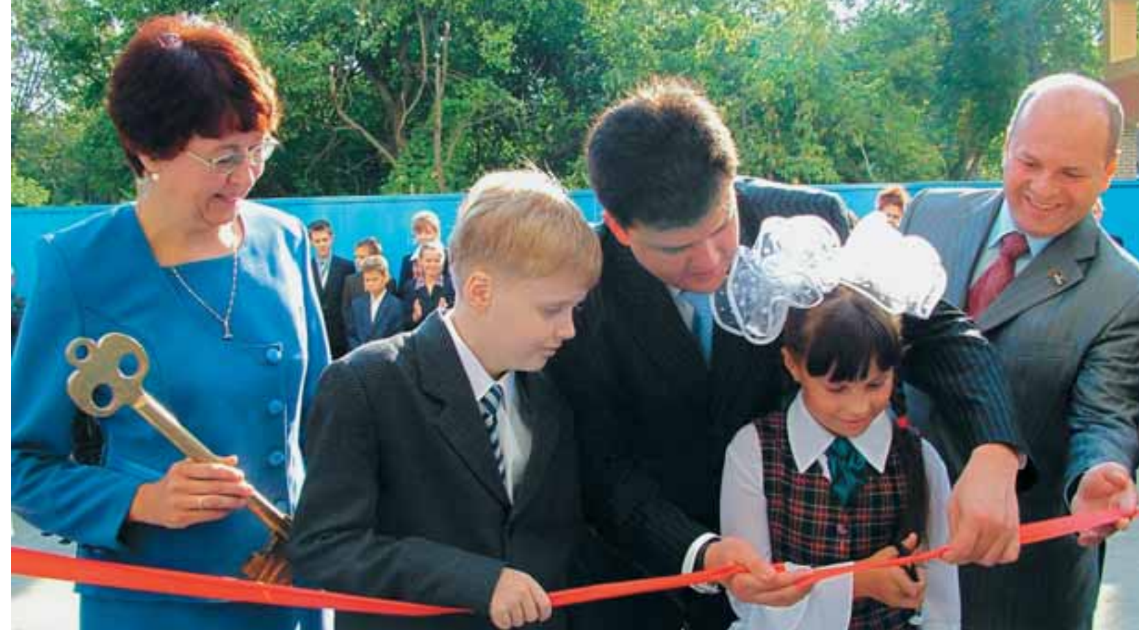
Открытие новой библиотеки в Калужской области ЦФО.