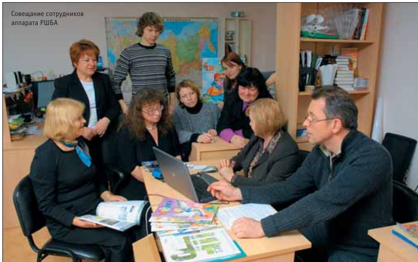
Совещание сотрудников аппарата РБША