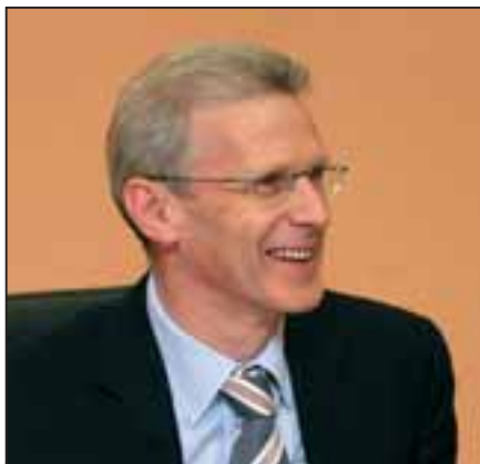
На фото: автор доклада А. А. Фурсенко , министр образования и науки Российской Федерации

С ложность темы определяется в значительной степени тем, что, действительно ситуация в библиотеках сегодня не идеальная. Проблем очень много, и решение этих проблем отстает от реалий жизни. Глобализация, стремительно расширяющая возможности обмена информацией, определяет то, что именно образование составляет основу как социального, так и экономического прогресса.